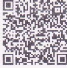
АРТУР ВАН ДИЗЕН

Представитель Детского Фонда ООН (ЮНИСЕФ) в Казахстане